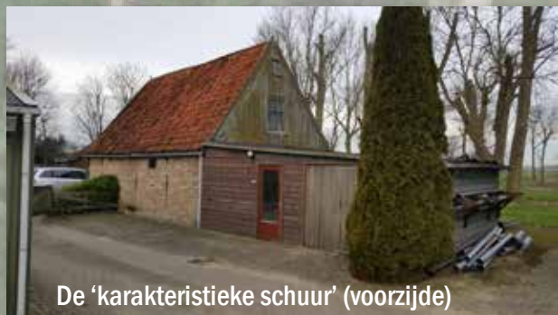
De 'karakteristieke schuur' (voorzijde)